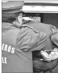
La detención del sujeto se concretó la mañana de ayer jueves por personal de la Tercera Comisaría de Los Andes. (Foto referencial)

Según pudo conocer "El Observador", H.E.E. había recuperado recientemente su li-