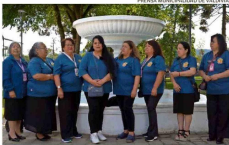
AGRUPACIÓN SOCIAL UN DÍA A LA VEZ.