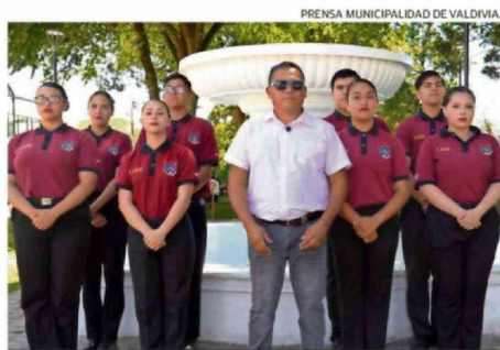
BANDA DE GUERRA DEL LICEO ARMANDO ROBLES RIVERA.

“Este proceso no solo se premia las trayectorias y proyectos, sino que también se fortalece el sentido de pertenencia, la participación y el orgullo por Valdivia. Cuando la ciudadanía se involucra de esta manera, queda claro que reconocer lo bueno que ocurre en nuestra ciudad también es una forma de construir futuro”.