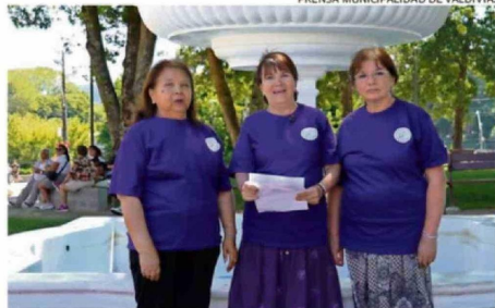
LA AGRUPACIÓN REDES QUE SANAN.