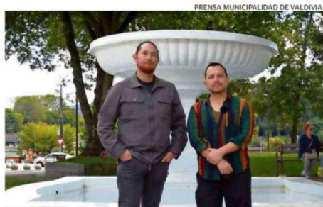
FUNDACIÓN SAN JORGE DESTACA POR SU TRABAJO EN LA COSTA.