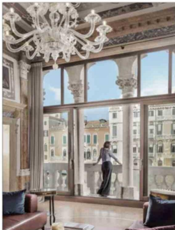
Por cuidado de patrimonio, los estucos, espejos y lámparas de estos palacios no pueden intervenir.

"Es un palacio precioso desde afuera. Todos los palacios que están en esa zona son maravillosos. Son como cuatro kilóme-