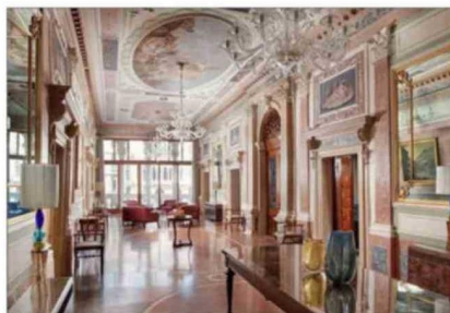
La restauración estuvo a cargo de una empresa con base en Milán, cuna del diseño italiano moderno.

tros y medio de canal en el que se pueden ver construcciones hermosas", señala.