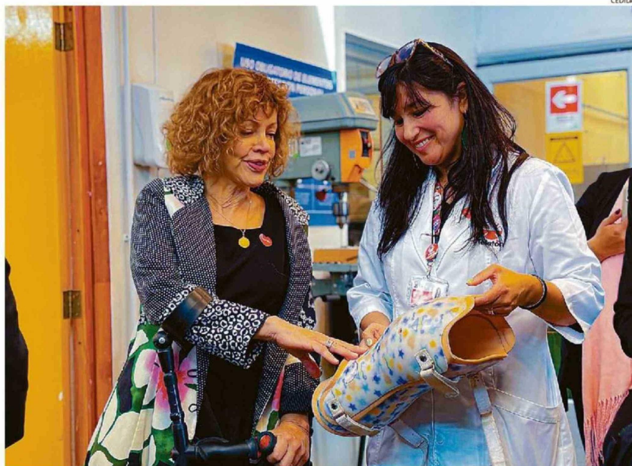
LA MINISTRA PAROT VISITÓ AYER EL INSTITUTO TELETÓN DE VALPARAÍSO Y COMUNICÓ EL COMPROMISO DEL GOBIERNO CON EL PROYECTO.

La directora general agregó que "queremos tener mayor accesibilidad, que nuestros pasillos sean más anchos, poder tener mejores baños, mejor infraestructura, para que esta rehabilitación, que es larga, se pueda entregar de