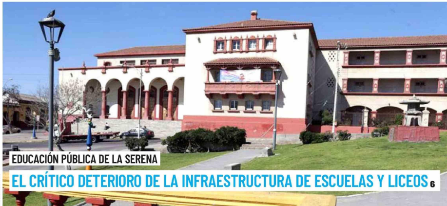
EDUCACIÓN PÚBLICA DE LA SERENA

Pese a las dudas iniciales, la DGAC aprobó y emitió el certificado de aeronavegabilidad necesario para que la aeronave destinada a Carabineros pueda prestar servicios en una serie de operativos como labores de rescate, seguridad y combate al narcotráfico. 5