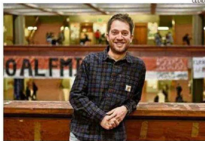
Boscaini es dr. en Ciencias Biológicas y Paleontólogo Naturalista.

“Ninguna crisis climática previa los afectó de manera tan radical, lo que apunta a la presión antropogénica como la variable nueva y como el golpe final.”