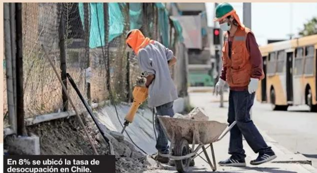
En 8% se ubicó la tasa de desocupación en Chile.