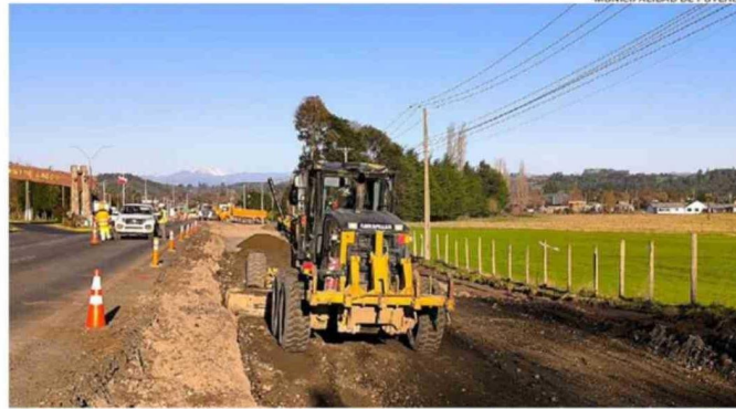
EN DISTINTOS PUNTOS DE LA VÍA SE REALIZAN TRABAJOS, POR LO QUE ES NECESARIO CONDUCIR CON PRECAUCIÓN.

sobre el nivel del mar tiene el paso fronterizo Cardenal Samoré, siendo el cruce límite terrestre más bajo entre Chile y Argentina.