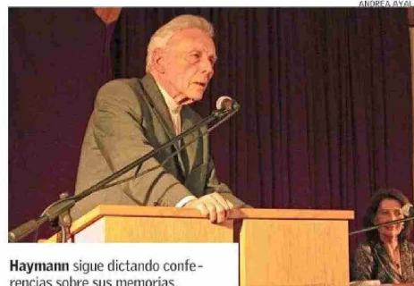
Haymann sigue dictando conferencias sobre sus memorias.