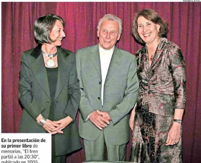
En la presentación de su primer libro de memorias, "El tren partió a las 20:30", publicado en 2005.

Tiraje: 126.654 Lectoría: 320.543 Favorabilidad: No Definida