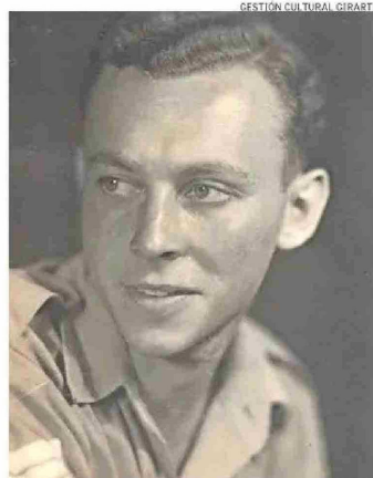
De descendencia judeoalemana, se reencontró con su familia en Chile tras 10 años separados. Aquí se casó, tuvo hijos y vive hace 75 años.