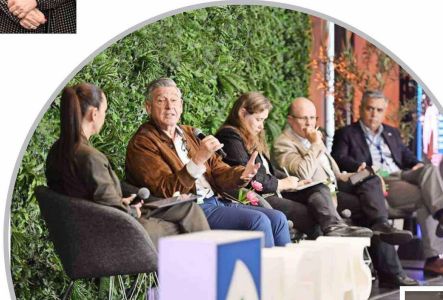
Aguas Andinas reunió a diversos expertos para reflexionar sobre proyecciones climáticas y desafíos hídricos de la Región Metropolitana.