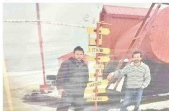
No sólo ha sido testigo de la conversión de la Base Escudero, de contenedores a una estructura definitiva, sino que participó en la construcción de la misma.