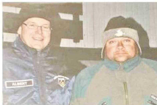
Entre muchas personalidades con las que ha estado en la Antártica figura el príncipe Alberto de Mónaco, en 2009.