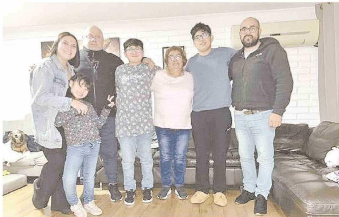
Su familia es el objetivo que tiene después de jubilar, porque les ha faltado más de alguna vez.

Una familia que se forma entre personas que nunca se han visto, que conviven meses en condiciones extremas, que aprenden a tolerar cómo el otro duerme, come o se viste. "Es como un reality verdadero", dice. "Pero uno conoce gente muy buena y aprende bastante". Ha transportado en embarcaciones al rey Alberto de Mónaco, al expresidente Sebastián Piñera y a Gabriel Boric cuando era diputado. "Son bien humildes, se acercan bien a la gente", dice. Ha visto lobos finos, elefantes marinos, orcas, jorobadas, pingüinos. Visitó dos veces la isla Cauquén, que descri-