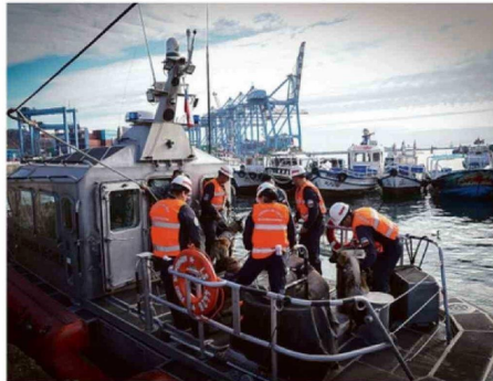
CANES DETECTAN DROGAS (MARIHUANA Y COCAÍNA) Y ARMAS.

Junto a lo anterior, la funcionaria destacó la efectividad que hay en la experiencia de trabajar junto a canes. Esto porque, en lo que res-