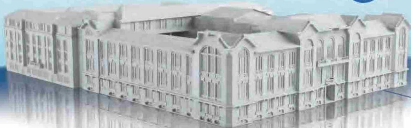
Modelo tridimensional de la Casa Central PUCV MONUMENTO HISTÓRICO NACIONAL

En 2025, la PUCV realizará una inversión histórica de $16.600 millones de pesos en infraestructura, priorizando el trabajo con empresas regionales.