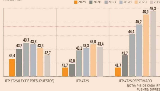
DEUDA BRUTA Y LA TRAYECTORIA REESTIMADA (% DEL PIB)

distintas variables del modelo y detectó la brecha. “Esa detección es la razón principal por la que la publicación del informe se postergó: publicar cifras inconsistentes habría sido un error mayor”, agregaron.