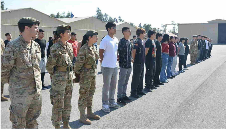
Un total de 87 voluntarios, en mayoría mujeres, conforman el gran contingente de jóvenes que se integran a las filas para cumplir con el Servicio Militar Obligatorio en Rancagua.