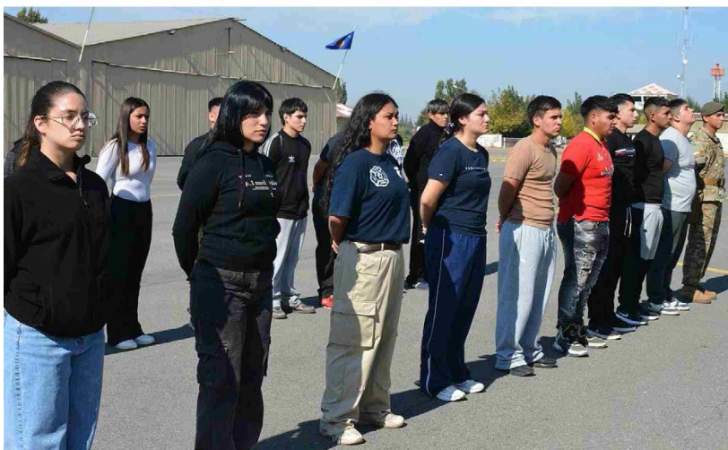
Alfredo Bravo

E n una solemne ceremonia realizada en las dependencias de la Brigada de Aviación de Ejército (BAVE) en Rancagua, se llevó a cabo la recepción formal de 87 nuevos voluntarios que se integran a las filas de la institución para cumplir con su Servicio Militar. La jornada destacó por una composición inédita en el contingente, donde los 87 seleccionados, 50 son mujeres y 37 hombres, quienes en su gran mayoría provienen de diversas comunas de la región de O'Higgins, reforzando el vínculo igualitario de la unidad con la zona.