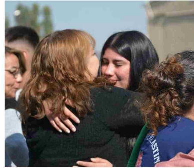
Jóvenes de la región de O'Higgins iniciaron este jueves su preparación para formar parte de la Guarnición de Rancagua.

vanha personal tras un intento previo de ingreso.