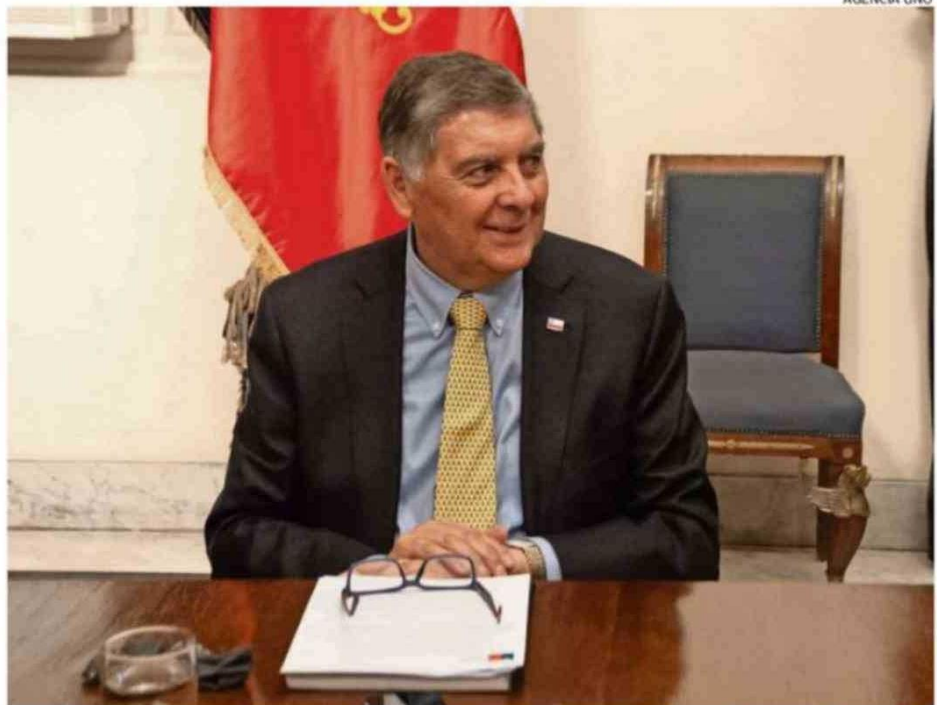
EL JEFE DE GABINETE TAMBIÉN RECONOCIÓ QUE HAY UN PLANO HUMANO EN ESTE CASO.

En entrevista con Radio Pauta, el jefe de gabinete sostuvo que "aquí hay que mirar dos planos. Un plano institucional y un plano personal humano. En el plano institucional, obviamente, todo gobierno tiene que velar por la continuidad de un servicio en los términos que se considere que es lo mejor para las funciones que ese servicio cumple. Y un cargo de Alta Dirección Pública, por naturaleza y por definición, es un cargo de exclusiva confianza, en el cual la autoridad puede solicitar ese cargo en