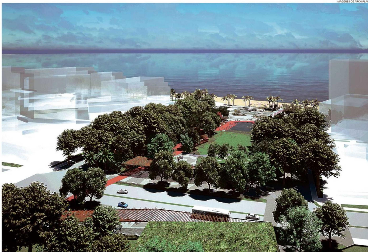
LA LÁMINA MUESTRA UNA PROYECCIÓN DE LA VISTA DESDE EL CERRO, EN QUE SE OBSERVA UN SECTOR DE LA PARTE BAJA DEL PARQUE URBANO EN SU LLEGADA A LA ZONA DEL BORDE COSTERO DE LAS SALINAS.

Tiraje: 11.000 Lectoría: 33.000 Favorabilidad: No Definida