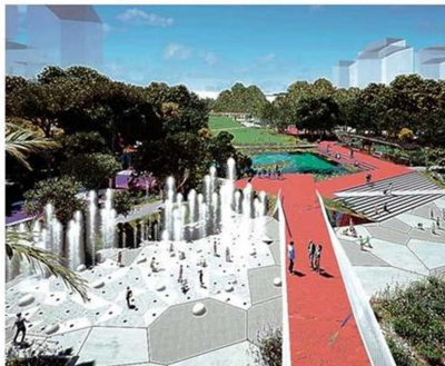
CHORROS DE AGUA EN UNA DE LAS PLACAS QUE RECORRE LA PASARELA.

- Confío poder avanzar sostenidamente en el desarrollo de este proyecto. Como le he compartido a mis socios, colaboradores, amigos y familia, sinceramente espero pasear por ese maravilloso parque con mis propios nietos, pues todo arquitecto quiere ver y experimentar su obra materializada, solo entonces nos realizamos completamente. ➡