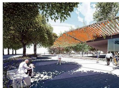
ACCESO AL RECINTO FERIA QUE CONSIDERA EL PROYECTO GANADOR.

privada y colectiva por parte del jurado, que luego de la deliberación y por unanimidad seleccionó cuatro para pasar a la segunda etapa y final.