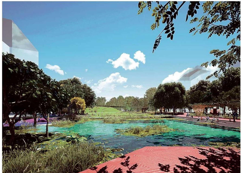
ASÍ SE PROYECTA EL HUMEDAL CENTRAL, UNO DE LOS SISTEMAS NATURALES REPRESENTADOS EN ESTA PROPUESTA DE PARQUE URBANO.

En la primera etapa se presentaron 15 propuestas, de las cuales fueron admisibles 14, las que fueron revisadas de forma