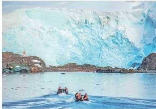
En el territorio antártico chileno el encargado de oficial el matrimonio civil es personal de la Fuerza Aérea.

“Nosotros llegamos a diferentes partes del territorio en la Región de Magallanes y de la Antártica Chilena a través de oficinas propias, pero también con un trabajo colaborativo. En el caso de Cerro Sombrero y Puerto Edén, con Carabineros,