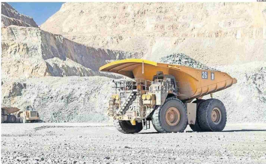
MINERA EL ABRA, UBICADA A 76 KILÓMETROS AL NORESTE DE CALAMA, POSEE UN ENORME YACIMIENTO DE MINERALES SULFURADOS DE COBRE.

CONCENTRADORA El informe además que detalló extensos programas de monitoreo y evaluaciones