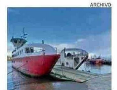
FUE CERRADO EL PUERTO

● Autoridades realizaron llamados a la comunidad a la prevención ante el sistema frontal. Por ejemplo, a mantener la techumbre de las viviendas en buenas condiciones, a no transitar por áreas inundadas, recoger hojas y basura en el frente de las casas a fin de evitar bloquear los sumideros de aguas lluvia; alejarse del tendido eléctrico, árboles y carteles publicitarios y realizar periódicamente la mantenimiento del método de calefacción. En el caso de Valdivia, el contacto de emergencias de la Municipalidad es el fono 632 314435.