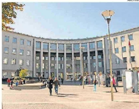
ERROR FUE DETECTADO EN EL 7° JUZGADO CIVIL DE CONCEPCIÓN.