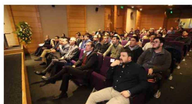
Alumnos del MBA asistentes a la inauguración del año académico.