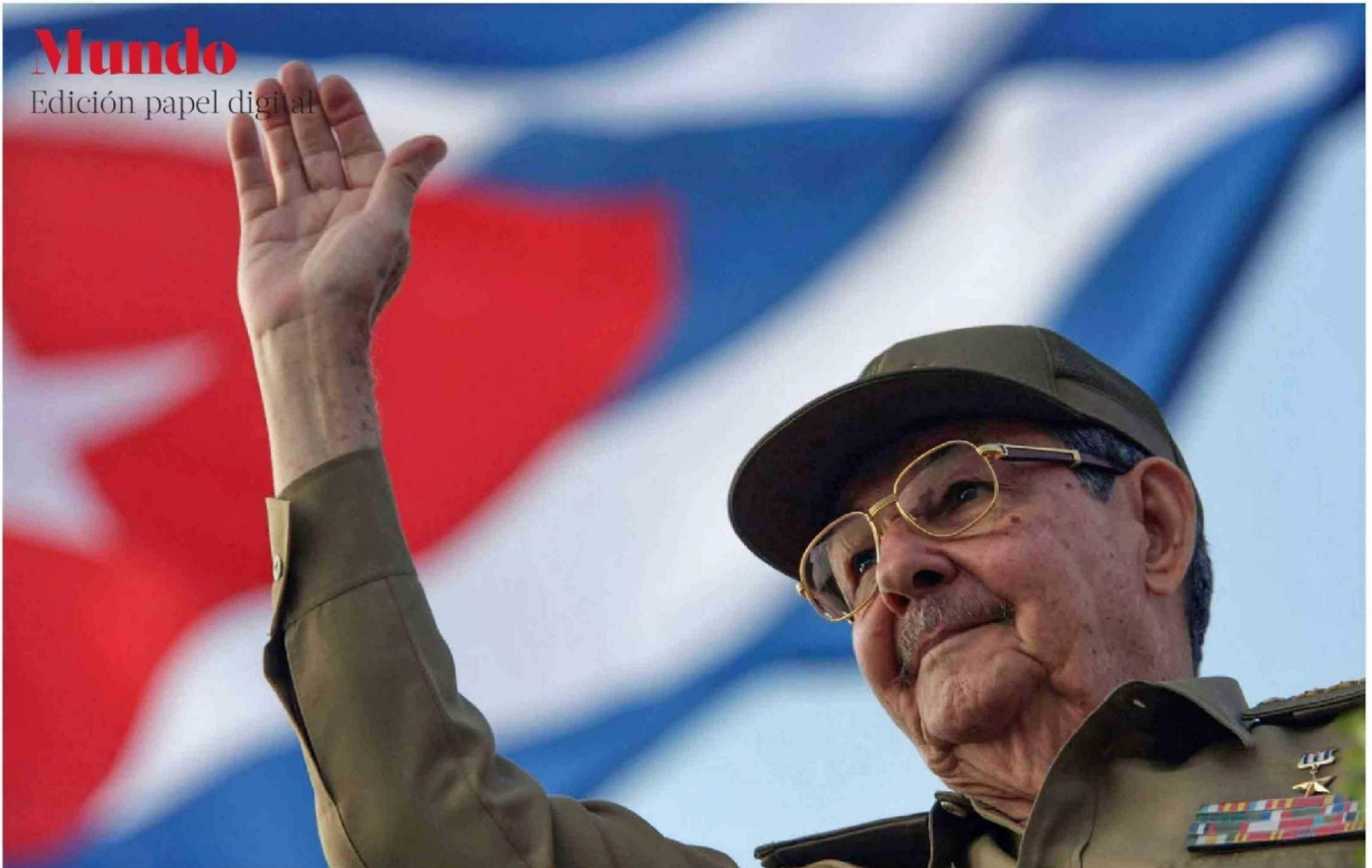
▶ Raúl Castro saluda a la multitud durante el desfile del Primero de Mayo en la Plaza de la Revolución de La Habana, el 1 de mayo de 2008.