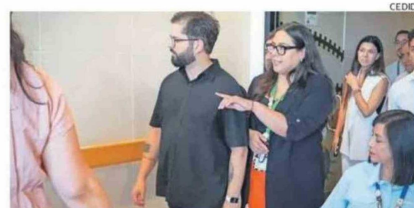
EL PRESIDENTE RECORRIENDO EL LUGAR

Durante el recorrido, el mandatario destacó el impacto de la obra para la región, señalando que "Atacama contribuye de manera muy significativa al crecimiento del país, y es justo que esa riqueza se traduzca en mejores condiciones de vida para sus habitantes". En esa línea, recalcó que la inversión pública en salud es cla-