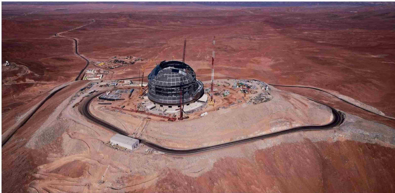
Se prevé que en 2028 esté listo el Telescopio Extremadamente Grande (ELT, por sus siglas en inglés), el que -entre otras cosas- buscará vida en el universo.

El también ex representante del Observatorio Europeo Austral (ESO en inglés) está convencido de que la construcción de este coloso de la astronomía, sumado a los observatorios ya existentes, permitirá la creación de actividades económicas que beneficien a las regiones receptoras de estos proyectos.