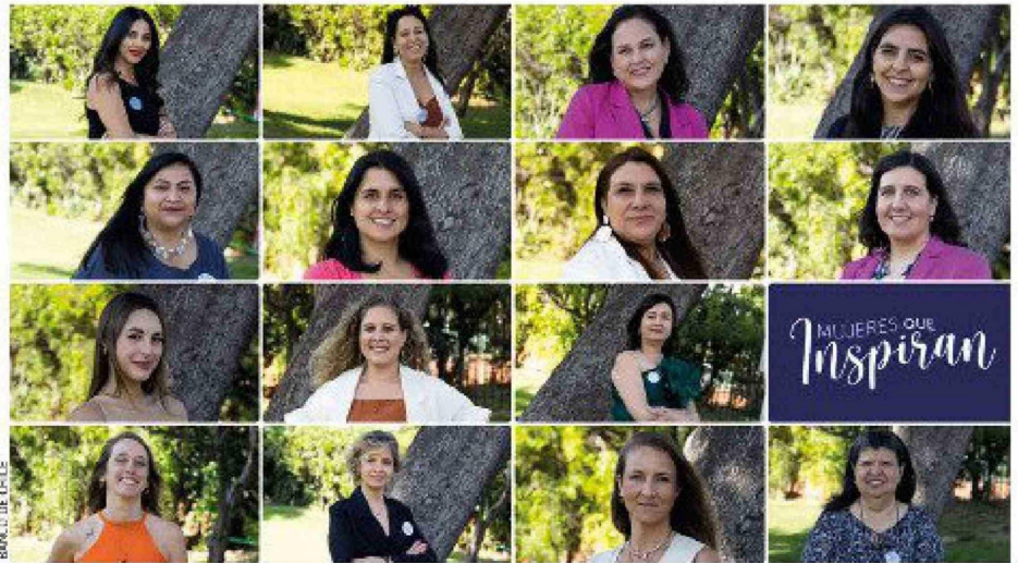
La edición 2025 de Mujeres que Inspiran cerró su convocatoria con un récord de 1.503 postulaciones de todo el país.

“En Banco de Chile estamos convencidos del impacto decisivo que tienen las mujeres en el desarrollo sostenible de nuestra sociedad. A través de la sexta edición de Mujeres que Inspiran, buscamos promover, apoyar y destacar a quienes están impactando su entorno y aportando, desde su trayectoria personal y laboral,