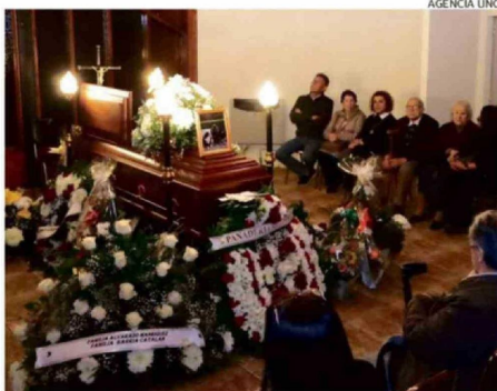
DESDE AYER SUS RESTOS SON VELADOS EN EL VALLE DEL CEDRÓN.

taló la carnicería más grande del sector y todo el barrio lo conocía. Como buen carnicero,