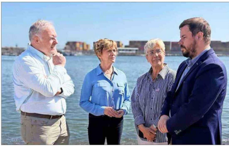
Evelyn Matthei estuvo en el puerto de Iquique para presentar su plan para enfrentar el narcotráfico.

Tiraje: 126.654 Lectoría: 320.543 Favorabilidad: No Definida