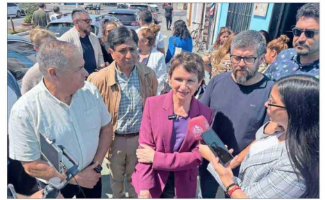
Carolina Tohá es la única candidata oficialista que ya ha estado en Tarapacá y Antofagasta.