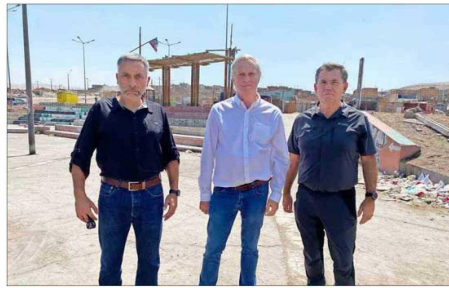
José Antonio Kast estuvo en Arica en marzo para dar a conocer sus medidas para “blindar la frontera”.