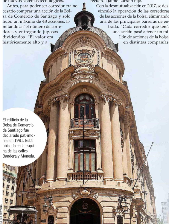
El edificio de la Bolsa de Comercio de Santiago fue declarado patrimonio en 1981. Está ubicado en la esquina de las calles Bandera y Moneda.