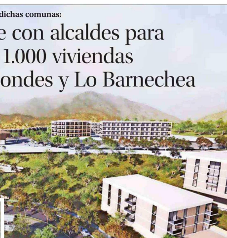
El render del proyecto "Vistas del Águila" que se levantará en Lo Barnechea.

timos con 19 canchas de tenis y fuimos entregando espacios hasta quedar con ocho", explica. Y ahora trabajan en un eventual traslado, "de presentarse un plan formal" a un nuevo recinto en el sector de Remanso.