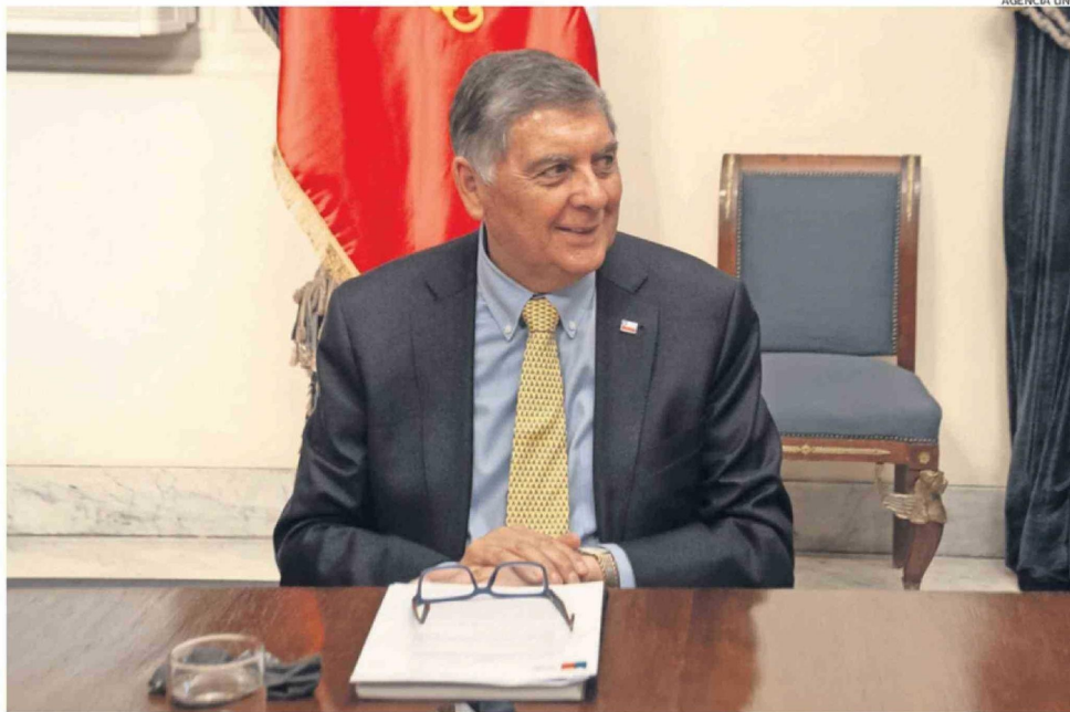
EL JEFE DE GABINETE TAMBIÉN RECONOCIÓ QUE HAY UN PLANO HUMANO EN ESTE CASO.