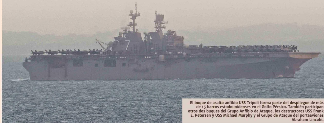
El buque de asalto anfibio USS Tripoli forma parte del despliegue de más de 15 barcos estadounidenses en el Golfo Pérsico. También participan otros dos buques del Grupo Anfibio de Ataque, los destructores USS Frank E. Petersen y USS Michael Murphy y el Grupo de Ataque del portaaviones Abraham Lincoln.

Según el experto, Trump espera que la presión económica ejercida sobre Irán lo obligue a “ceder rápidamente”, pero -a su juicio- “el régimen iraní es ingenioso, implacable y está luchando por su supervivencia”.