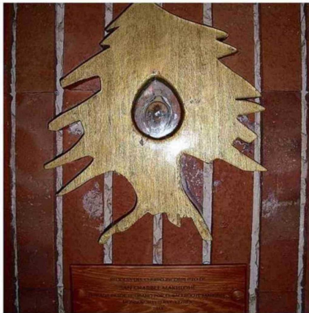
RELICARIO DE SAN CHARBEL, CON LA FIGURA DEL CEDRO LIBANÉS, EN LA PARROQUIA DE REÑACA.

La devoción por este santo maronita crece con fuerza en el país. Impulsada por testimonios de milagros, su figura se ha convertido en un pilar de esperanza para miles de fieles católicos chilenos.