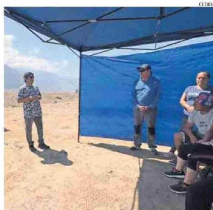
LA INICIATIVA ESTÁ ORIENTADA A FORTALECER EL TRABAJO COMUNITARIO.