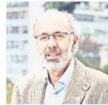
Confianza en un 2026 de crecimiento e inversión para la región del Biobío

fíos al 2050, además de intercambiar experiencias sobre políticas públicas exitosas en el sur de Brasil para atraer inversión privada. Durante este bloque, ambas regiones firmaron un acuerdo de colaboración, orientado a