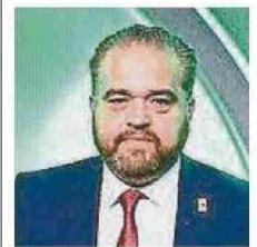
Sergio Giacaman, gobernador regional Biobío

"Estamos en un momento crítico y mi interés es provocar al sector productivo, al sector privado para ser más irreverentes con Santiago y, particularmente con el gobierno. Creo que es necesario poder tensionar esa conversación de buena manera para poder obtener cosas para nuestra región. Espero un sector productivo irreverente, capaz de movilizar a nuestra región para volver a ser lo que era, el motor productivo de nuestro país".