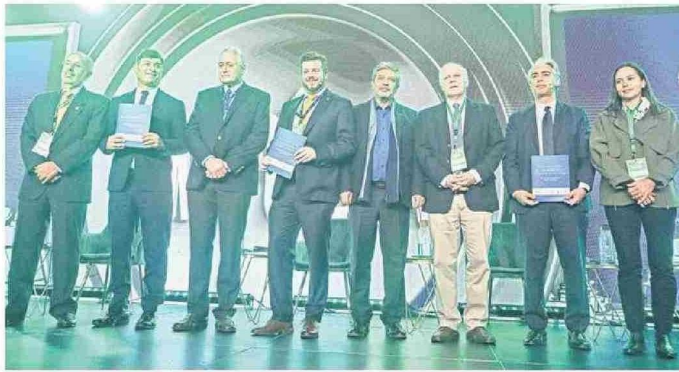
CANDIDATOS PRESIDENCIALES SE FUERON CON SUGERENCIAS PARA SUS AGENDAS DESDE EL BIOBÍO.

La séptima edición de Impulsa, organizada por CPC Biobío, reunió este año a más de 800 invitados en el corazón industrial del sur de Chile, consolidándose como el principal encuentro empresarial de la región. El evento se centró en proyectar estrategias para una región y un país más competitivos, sostenibles y con liderazgo territorial, mediante la discusión de experiencias na-