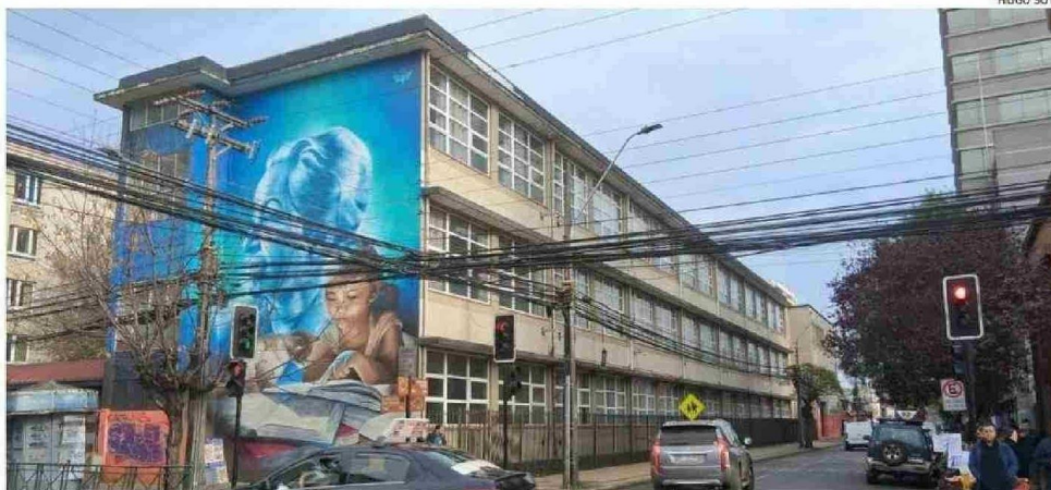
UNA PARALIZACIÓN DE FUNCIONES DE CORTE PACÍFICO ESTÁ LLEVANDO ADELANTE EL LICEO GABRIELA MISTRAL.

"La comunidad del liceo no se siente cómoda con las condiciones en que se encuentra el edificio, que tiene casi 70 años, y obviamente hay espacios y situaciones que hacen poco cómodo el devenir diario, si bien hay que reconocer que dentro de todo el Departamento de Educación está en norma", apuntó el director, quien agregó que ayer lunes se realizó un contacto inicial con el Daem y