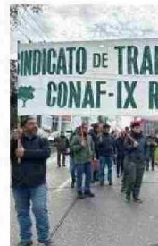
TRABAJADORES DE CONAF CHARON POR CALLE BULNE

de Temuco, el Pablo Neruda, tuvo clases normales, las que se verán interrumpidas hoy por el paro de profesores.