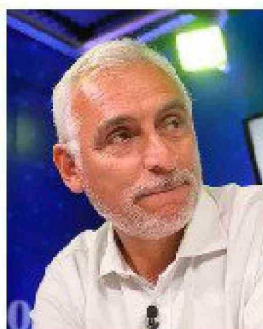
Gobernador Regional, Pablo Silva.

El gobernador regional Pablo Silva Amaya condenó el hecho, señalando que se trata de una situación "inaceptable". "Es una situación que nos da pena y mucha rabia también. Inaceptable el mal uso de licencia médica para salir de vacaciones o salir de viaje. Eso perjudica a todos los buenos funcionarios