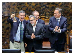
El senador RN junto a la mesa saliente y quien será su vicepresidente, Ricardo Lagos Weber (PPD).

Fue desechado acuerdo previo para la testera: