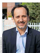
Senador Daniel Núñez (PC):

Presidente de comisión de comisión afirma que no se van a dejar "presionar ni chantajear por la violencia"