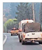
Anuncian apertura de investigación por homicidio frustrado.

VISIÓN DE LOS INDUSTRIALES E INCIDENTES EN MANIFESTACIONES | B 1 y C 1