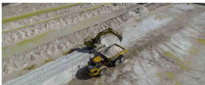
PAGOS A CORFO DE SQM Y ALBEMARLE

En esta línea, el litio experimentó durante 2025 una variación alcista, promediando en la primera mitad del año US$9.704 la tonelada de carbonato de litio; mientras que en la segunda parte US$11.284 la tonelada, en base a datos obtenidos por GEM. Entre los semestres la marca del litio observó un alza de 16%. Con esto, el promedio del año pasado fue de US$10.365 la tonelada, 18% menos que en 2024.