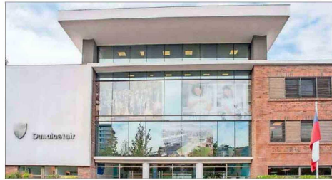
Colegio Dunalastair, del grupo Cognita.

Otro de los grupos que han crecido con fuerza en Chile es International Schools Partnership (ISP), red internacional que