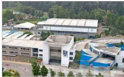
Trehwela's School, del grupo Nord Anglia

opera decenas de colegios en el mundo y cerca de 30 en América Latina. En Chile cuenta con su presencia en los cuatro colegios Pedro de Valdivia y el British Royal School.