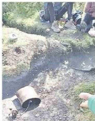
Se aprecia al guía señalando la transgresión a la normativa vigente.

Indignación generó un video difundido en redes sociales que muestra a un grupo de turistas españoles fumando al interior del Parque Nacional Torres del Paine, una conducta expresamente prohibida y considerada de alto riesgo para la prevención de