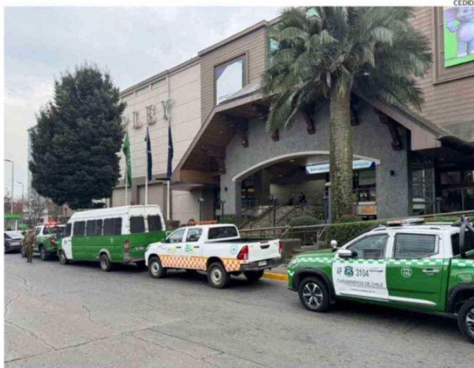
PASADAS LAS 8 DE LA MAÑANA, PERSONAL DEL SAMU Y DE CARABINEROS ASISTIERON Y TRASLADARON A MENOR.

La agrupación civil Salud Mental Digna, organización que na-