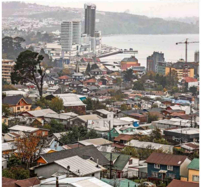
EL ARTÍCULO 5 BUSCA REFORZAR LA INTENSIFICACIÓN URBANA, CON AUMENTOS DE ALTURA Y DENSIDAD.

Debido a su carácter menor y acotado, esta herramienta no requiere someterse a una Evaluación Ambiental Estratégica ni, hasta el momento según los informes técnicos, a una consulta indígena, dado