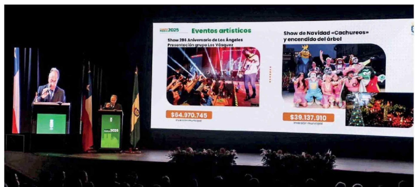
PRESENTACIÓN CON LÁMINAS proyectadas acompañó la exposición del balance municipal durante la Cuenta Pública 2025 en el Teatro Municipal de Los Ángeles.