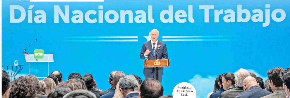
Presidente José Antonio Kast.