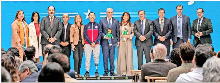
Presidente de la República, José Antonio Kast, junto a autoridades y representantes de la Achs.