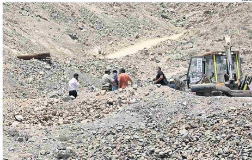
TODAVÍA FALTA POR MUCHO MEJORAR EN MINAS DE TIERRA AMARILLA Y LA REGIÓN.

Por causas que aún no han sido determinadas, el hombre