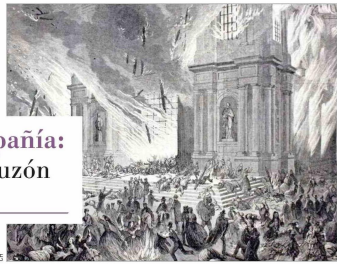
Una de cada 27 mujeres de Santiago murió en el feróz incendio de la Compañía. ¿Corresponde que ellas salgan de la casa para ir a rezar? Esa fue una arista del debate posterior.

Según Sol Serrano, la discusión posterior puso en el tapete la definición de lo público y lo privado en el eje religioso, y el debate sobre el espacio que le correspondía a las mujeres. También mostró la tensión entre el cuidado del hogar que se le