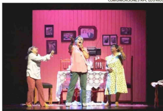
EL MONTAJE DE “RÉPLICAS” SERÁ EL ENCARGADO DE CERRAR LA AGENDA.

co, en su mayoría habitantes de la comuna de Panguipulli.