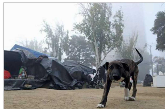
Si bien los migrantes reconocen las precarias condiciones las que viven, trabajan al día para buscar una solución habitacional de cara al invierno.

Paralelamente esto, el Delegado Presidencial agrega “también tiene una dimensión que es humana y en ese sentido, hemos trabajado con la Seremi de Desarrollo Social donde se están solicitando más recursos para adelantar el programa de invierno, aumentar la cantidad de albergues y sacar estas personas de la calle. Mientras tanto, trabajamos en la ley de migraciones y resolver su situación, sin olvidarnos de la dimensión humana que hay detrás. También hay una cantidad de chilenos importante, donde ellos al tener un rut el Estado puede accionar, porque son ciudadanos chilenos y tienen un status legal”.