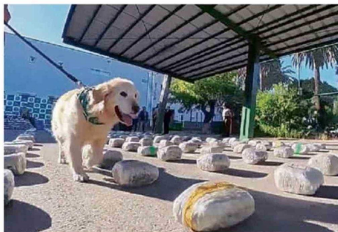
LA LABOR DE LOS PERROS DETECTORES DE DROGA FUE CLAVE. }

taba estacionado con sus luces apagadas y con su conductor en el interior usando su teléfono celular. Este hombre también fue fiscalizado y, según indicó el prefecto (s) de la Prefectura de Carabineros Marga Marga, mayor Mario Rojas, "con el apoyo de nuestros perros detectores de droga se detecta inmediatamente el cargamento de droga, que son 844 kilos de marihuana, que son 2 millones 500 mil dosis que se sacan de circulación, además de casi 10 mil millones de pesos el avalúo total al precio minorista". También se deco-